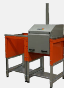
Flerkammerpressen er forsynet med en dækplade med to håndtag