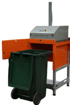
Designet til at passe standardbeholdere på 240 liter

Sikkerhed og kvalitet er vores kendetegn, og beholderpressen giver maksimal personsikkerhed både for operatøren og dem i umiddelbar nærhed. En indikator sikrer, at maskinen kun kan starte, når beholderen er i den rigtige position.