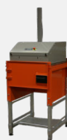
Enkeltkammerpresse med svingdør

Den er let udvidet med ekstra kamre. Døren til enkeltkammeren udskiftes derefter med en dækplade, der gør det nemt at flytte trykhovedet fra et kammer til det næste.