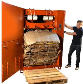
Tryk blot på to knapper til balleudkast!!