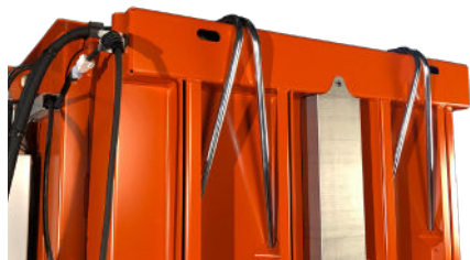
Rør til nem snøring af ballen

Ballepresseren er hurtig, og med en cyklistid på kun 16 sek. er den klar til en ny ladning af papkasser eller plastfolie på ingen tid, og autostart er en standardfunktion! 3220 kan betjenes manuelt, men køres helst i autotilstand for maksimal produktivitet og bekvemmelighed.